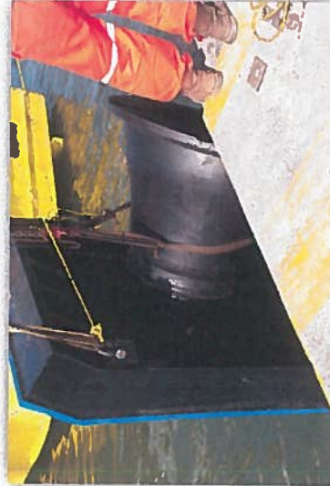
SUMINISTRO Y COLOCACION DE DEFENSAS NUEVAS