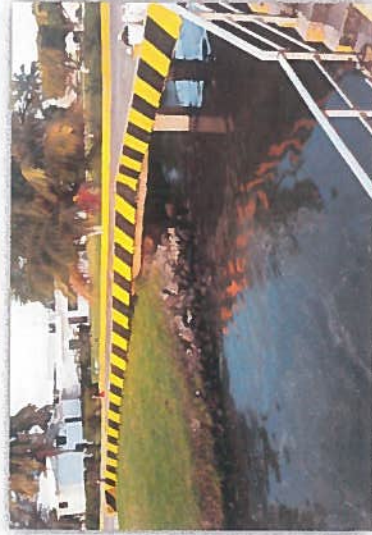
PINTURA A MUELLE DE DRAGAS