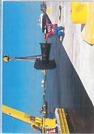
SUMINISTRO Y COLOCACION DE DEFENSAS NUEVAS