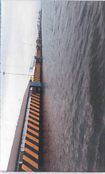
VISTA LATERAL DEL MUELLE FISCAL