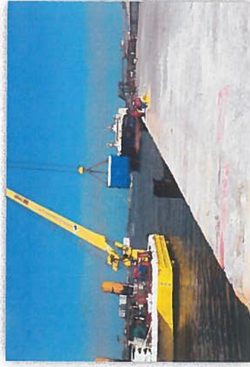
SUMINISTRO Y COLOCACION DE DEFENSA