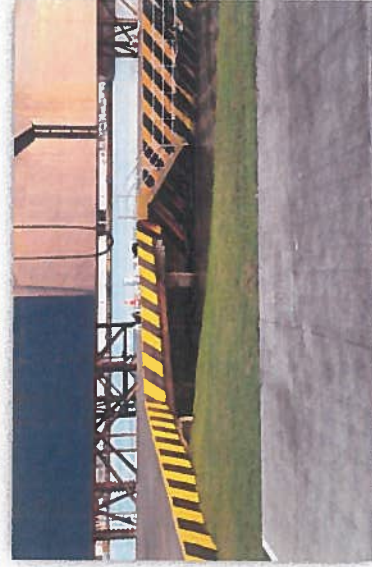
PINTURA A MUELLE DE DRAGAS