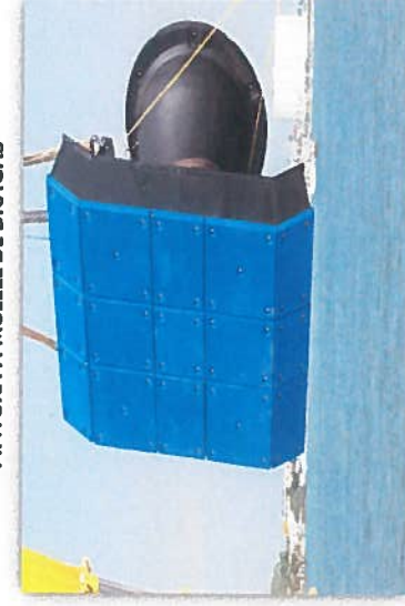
SUMINISTRO Y COLOCACION DE DEFENSAS NUEVAS