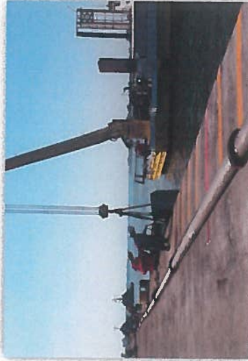
SUMINISTRO Y COLOCACION DE DEFENSAS NUEVAS