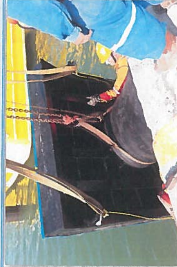
SUMINISTRO Y COLOCACION DE DEFENSAS NUEVAS