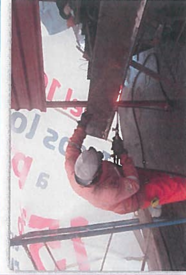
REPARACION DE DEFENSA #3