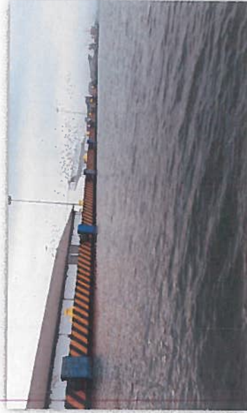
PINTURA EN MUELLE Y COLOCACION DE DEFENSAS