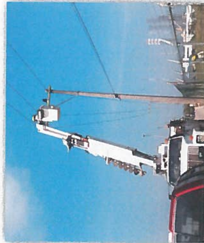
DESMANTELAMIENTO Y RETIRO DE CABLE DE ALUMINIO AAC 266.8