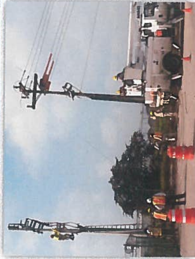
PREPARACIONES PARA INTERCONEXIÓN DEL SISTEMA 34.5 KVA