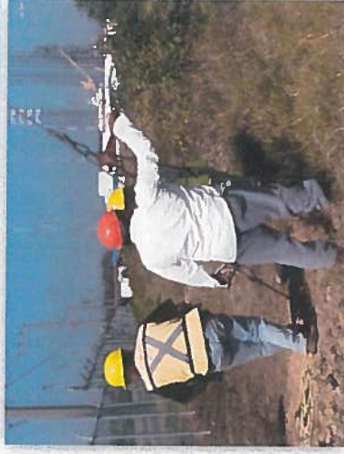
DESMANTELAMIENTO Y RETIRO DE RETENIDA