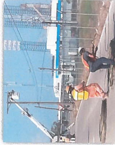
DESMANTELAMIENTO Y RETIRO DE CABLE DE ALUMINIO AAC 1/0