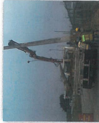
DESMANTELAMIENTO Y RETIRO DE POSTES DE CONCRETO PC-13-600