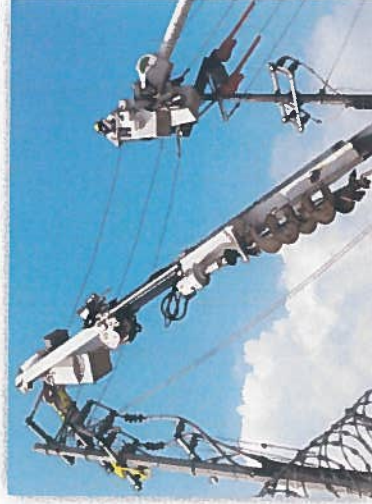
INTERCONEXIÓN DEL SISTEMA 34.5 KVA