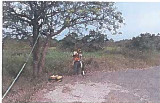
Brigada de topografía realizando levantamiento del terreno natural.