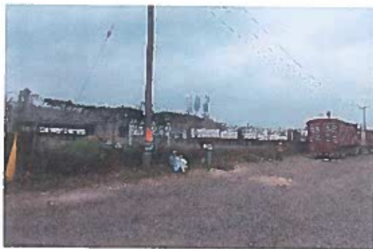
Proceso de limpieza de maleza y desmonte