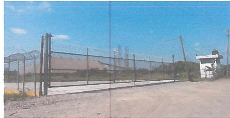
Terminación de Fabricación e instalacion de Portón de Acceso Vilidad