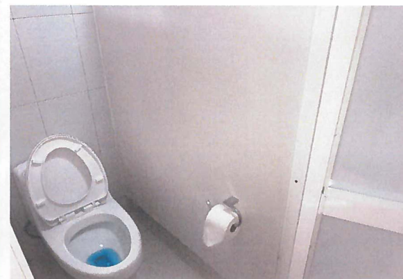
Suministro y colocación de sanitario ONE PIECE WC. 4004.01 blanco dica o similar en baños de hombres y mujeres