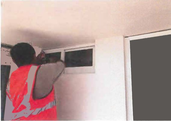
SELLADO DE CANCELERIA