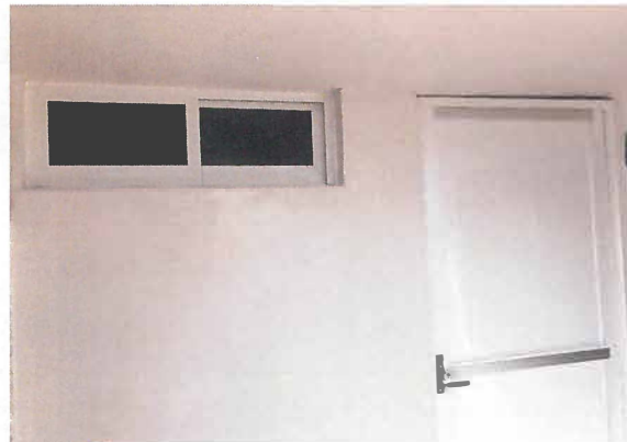
MANTENIMIENTO E INATACION DE CANCELERIA DE ALUMINIO Y PUERTA DE ALUMINIO