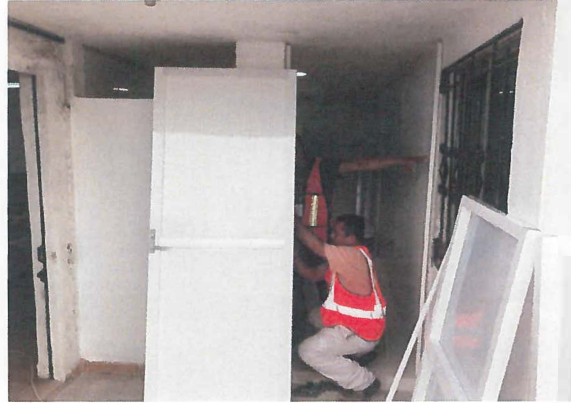
MANTENIMIENTO A PUERTA DE ACCESO