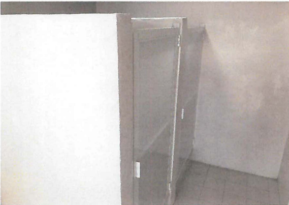
COLOCACION DE MAMPARAS