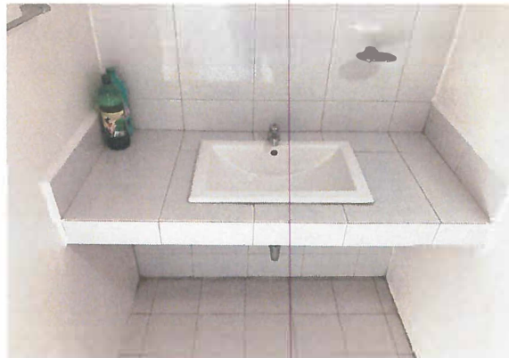
COLOCACION DE LAVABO