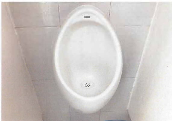
COLOCACIÓN DE MINGITORIO