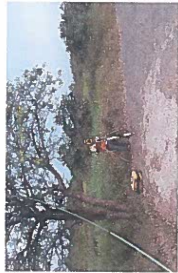
Brigada de topografía realizando levantamiento del terreno natural.