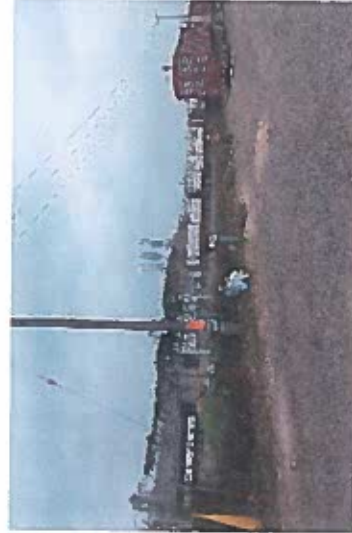
Proceso de limpieza de maleza y desmonte