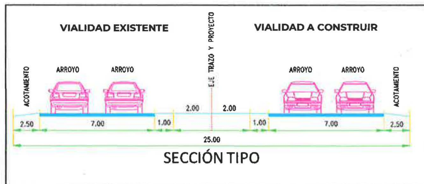
Imagen 02.- Sección tipo para el Complemento del Libramiento.

Con esta obra se tendrán 2 carriles de circulación, cada carril tendrá 3.5 m de ancho y acotamientos de cada lado de 2.5 metros a los costados, acotamientos centrales de 1.00m por sentido y separador interno de 2.00 m de ancho de vialidad para un total de construir de 12.50 m, con la finalidad es construir una vialidad tipo A2 a A4.