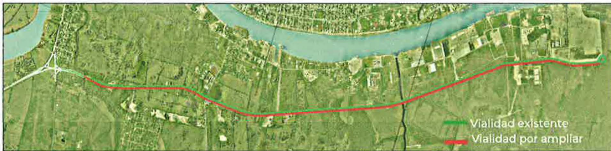
Imagen 01.- Vista en planta del complemento del Libramiento de acceso al Puerto.

Con esta obra se tendrán 2 carriles de circulación, cada carril tendrá 3.5 m de ancho y acotamientos de cada lado de 2.5 metros a los costados, acotamientos centrales de 1.00m por sentido y separador interno de 2.00 m de ancho de vialidad para un total de construir de 12.50 m, con la finalidad es construir una vialidad tipo A2 a A4.